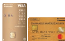
大丸松坂屋 ゴールドカード