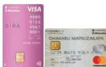
大丸松坂屋 カード

下記クレジットカードをアプリにご登録いただくと ポイントがいつでもアプリで ご確認いただけるようになります。