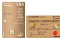
大丸松坂屋お得意様 ゴールドカード