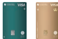
博多大丸 孔雀カード