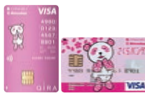
さくらパンダ カード